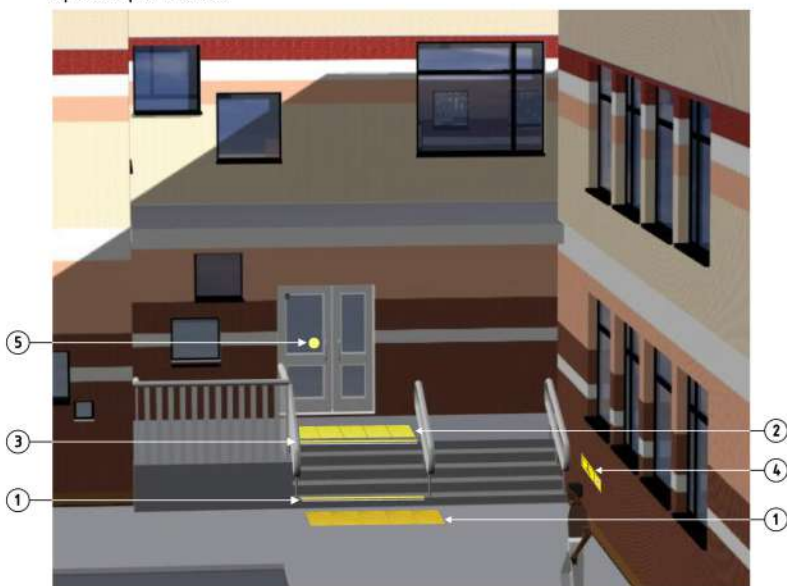
ВЕДОМОСТЬ ОБОРУДОВАНИЯ И ИЗДЕЛИЙ С ТАКТИЛЬНЫМИ УКАЗАТЕЛЯМИ